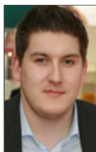
Alexander Münkel ITscope